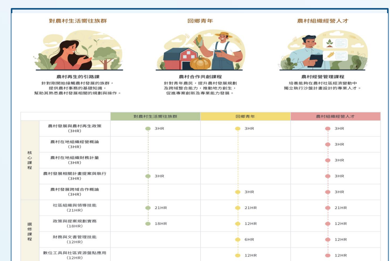
▲農村人才培訓地圖

委託機關：農業部農村發展及水土保持署產業發展及休閒組 受託單位/設計監造單位：鴻星數位科技股份有限公司 執行期間起迄：113年02月- 113年12月