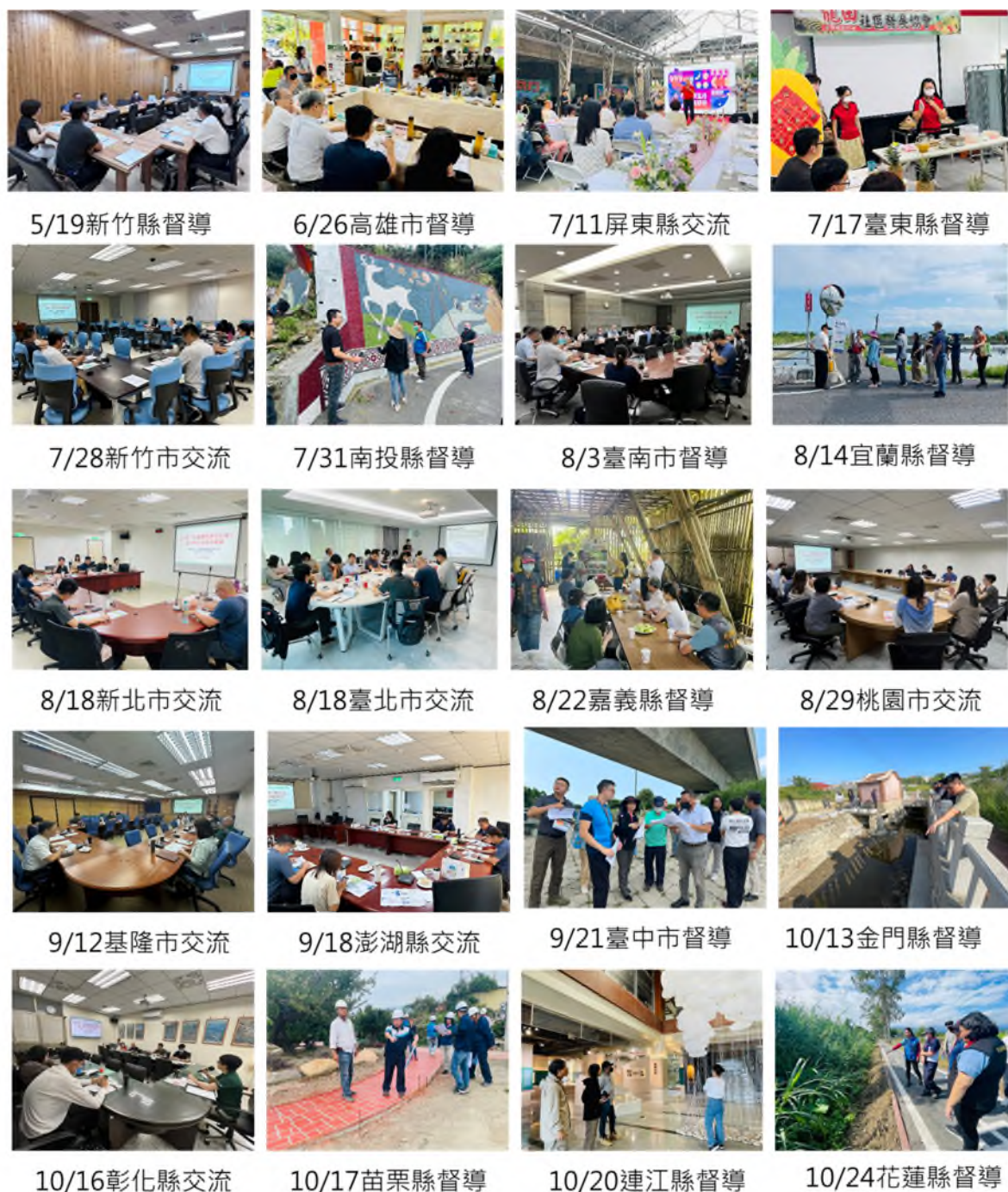
圖 5 112 年社區農村再生計畫各縣市督導考核及交流座談會辦理情形