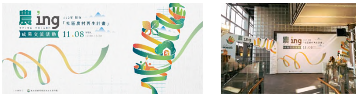
圖 6 112 年縣市「社區農村再生計畫」成果交流活動主視覺及相關應用

社區的積極與熱情參與外，機關推動的辛勞與長期投入也是支持並成就農再發光發熱的光環，於此，特辦理 112 年縣市「社區農村再生計畫」成果交流活動，規劃主題講座與分享議題，供各縣市進行議題交流，吸取寶貴經驗化為成長養分，進而刺激各縣市之農再整合工作與策略，並透過推動農再計畫之機關辛勤人員表揚，肯定對農再計畫推動工作之貢獻，促使農村再生之豐碩果實能處處開花結果。