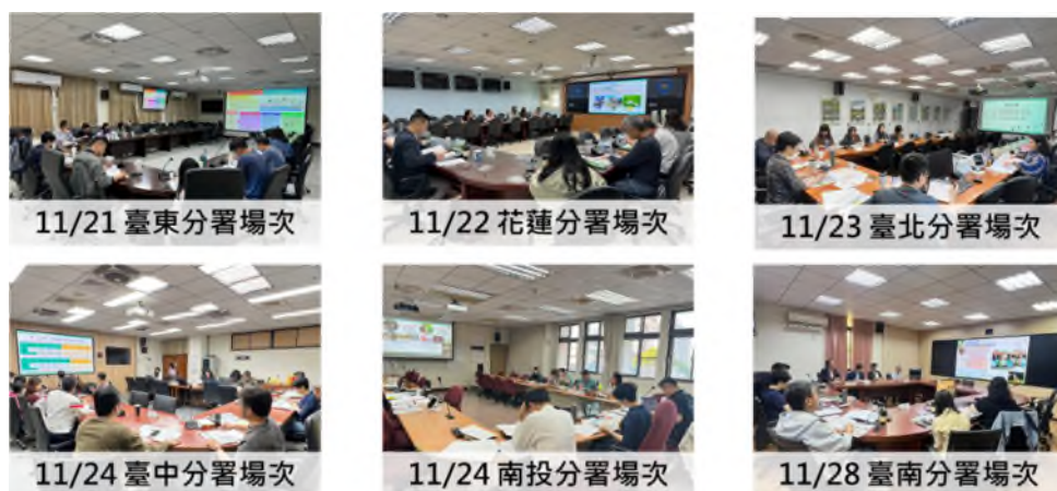
圖 3 113 社區農村再生計畫會前會辦理情形