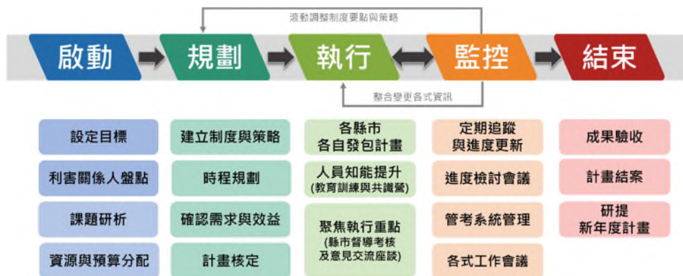
圖 1 本計畫推動之各階段專案管理策略

畫；計畫核定後即刻進入執行與監控階段，此階段將會有大量資訊需進行統整與更新，並進而帶動計畫滾動調整策略與制度要點，並再次進行整合與持續監控，監測變動狀態，並加以彙整分析，協助各直轄市、縣（市）政府於計畫結束階段能夠聚焦收斂成果，並研提新年度計畫。