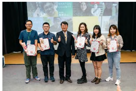
圖 8 112 年縣市「社區農村再生計畫」成果交流活動_優秀人員表揚

本次成果交流活動以主題講座與專題分享的形式進行，邀請揚名國際的黃聲遠建築師以「人地關係與城鄉美學」為題，闡述如何透過建築重建人與土地的關係、緊密人與人之間的關係，為在場近百位中央與地方的農村發展工作者帶來啟發與鼓勵。