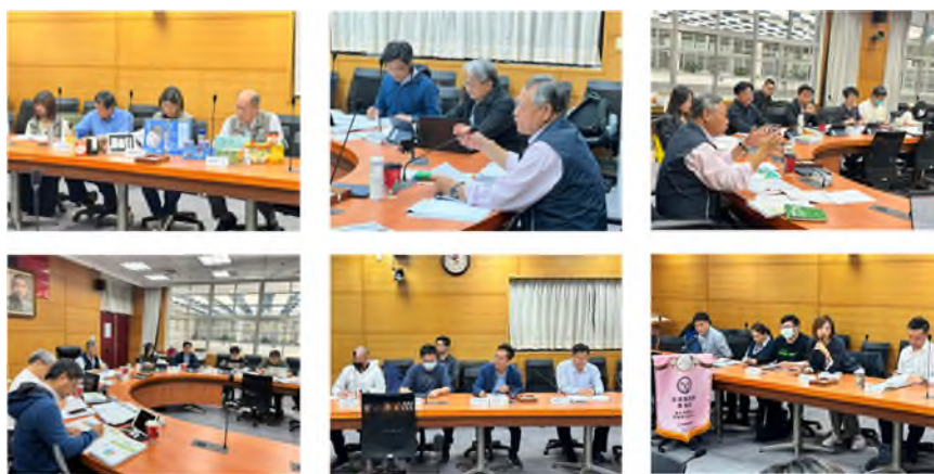
圖 4 113 社區農村再生計畫複審會議辦理情形

另，113 年匡列預算與往年相比比例下降許多，考量提案公平性、除了依據匡列預算、縣市政府配合款比例及提案內容加以評估外，也邀請委員依據審查期間的提案簡報說明，綜合縣市願景、發展主軸及 112 年成果、113 年亮點，給予建議反饋，以及本署補助經費之建議。