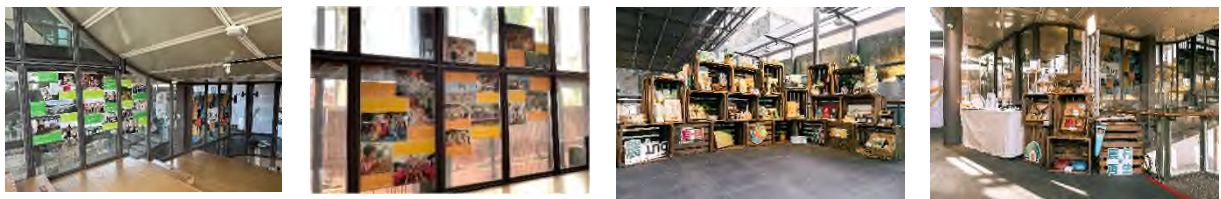
圖 7 112 年縣市「社區農村再生計畫」成果交流活動_縣市成果微型影展及成果交流展示區