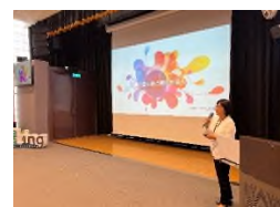
圖 9 112 年縣市「社區農村再生計畫」成果交流活動_主題講座與縣市分享